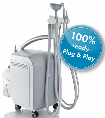
Variosuc: Sistema móvil para 1 usuario

Si la nube de aerosol no se aspira correctamente de la boca del paciente, se forma un aerosol que se expande en un radio de varios metros y representa un elevado riesgo de infección para el equipo de la clínica. El aerosol contaminado permanece hasta 30 minutos en el aire ambiente (véase también: Drisko et al, 2000, Bennet et al, 2000).