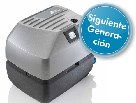
Tyscor VS 4 para 4 usuarios