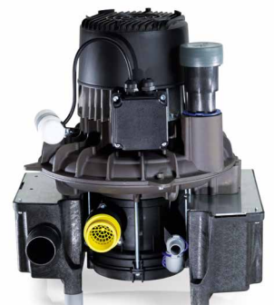
VS 600 para 2 usuarios