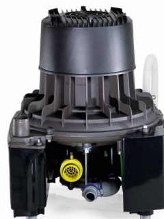
VS 300 S para 1 usuario