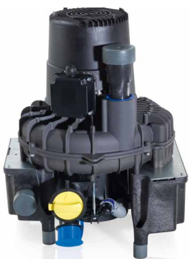
VS 900 S para 3 usuarios VS 1200 S para 4 usuarios

*Resultados de medición mediante análisis interno, Septiembre 2020, Dürr Dental