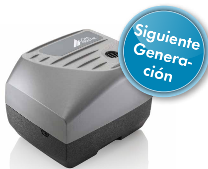
Tyscor VS 1 para 1 usuario Tyscor VS 2 para 2 usuarios